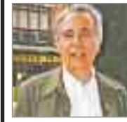
Tomás Ramos Poeta / Escritor

sin embargo, se mantienen los puntos de encuentro habituales de la ciudad en los diferentes barrios; al tiempo que están surgiendo otras localizaciones más alejadas o inclusive fuera de la ciudad para sus quedadas nocturnas. Esta campaña estuvo apoyada por el video de sensibilización “Cuida tu Salud y protege a tus colegas”, protagonizada por el grupo de teatro La Locandiera, bajo la premisa “sin mascarilla a ningún lado, por ti y por el resto de colegas”. Cabe señalar que se intervino en zonas del Casco Histórico y de los diferentes barrios: entorno de la Plaza de la Victoria, exteriores de bares y terrazas, Parque O’Donnell, Parque Juan Pablo II, Plaza del Viento, Parque de la Juventud, El Boinsan, Plaza del Barro, Plaza 1 de Mayo, aparcamientos de Ciudad Universitaria, entre otros. El concejal insistió “seguiremos apoyando las medidas preventivas con nuevas intervenciones en septiembre, porque los datos de rebrotes se producen entre los jóvenes con edades comprendidas entre los 15 y los 29 años; pero el mensaje no trata de continuar en confinamiento, sino de disfrutar de la nueva normalidad, donde salir implica hacerlo con prevención y no confiándonos en el ambiente relajado o porque son colegas no hay probabilidades de propagación. Estoy convencido que con conciencia y responsabilidad, podemos construir un ocio seguro y sin riesgo” .