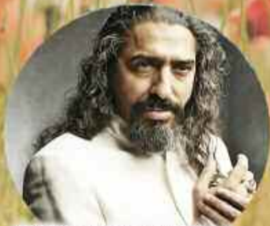
DIEGO EL CIGALA